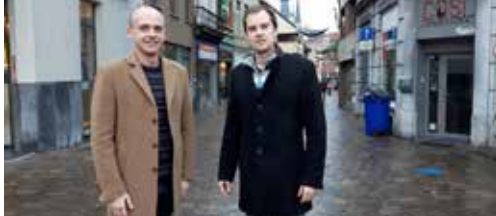
Leegstand centrum Aarschot nooit zo hoog (p. 2)