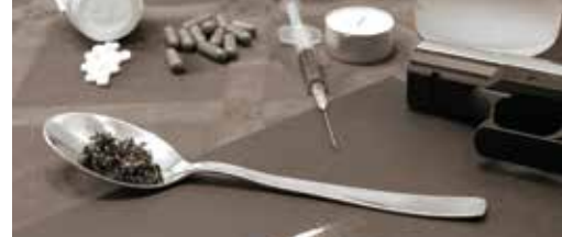
Meer druggebruik: N-VA roept op tot actie (p. 3)