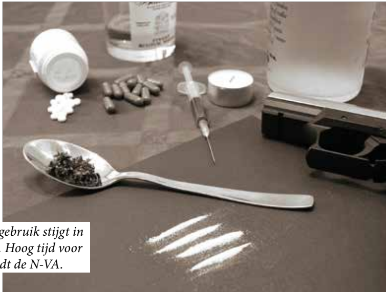
▲ Het druggebruik stijgt in Aarschot. Hoog tijd voor actie, vindt de N-VA.